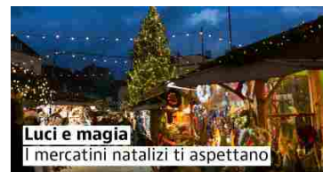
Luci e magia I mercatini natalizi ti aspettano

Ranking: 20 case in vendita con prezzi trattabili