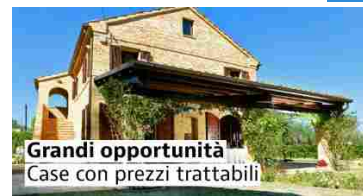
Grandi opportunità Case con prezzi trattabili