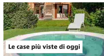
Le case più viste di oggi

Case vacanze: Mercatini di Natale 2024 in Italia: i più suggestivi e originali